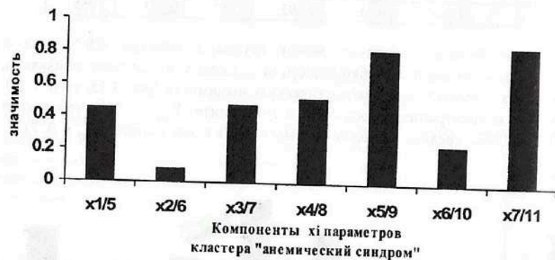
Рис. 7.14. Результаты ранжирования 7-ми компонент x_i кластера «анемический синдром», определяющих вектор состояния организма человека – ВСОЧ при использовании нейро-ЭВМ (настройки нейросети) с целью сравнения параметров порядка больных СД-2 типа в стадии компенсации (I гр.) и больных СД-2 типа в стадии декомпенсации (III гр.).

Существенная диагностическая значимость определяет следующие анализируемые признаки как параметры порядка для идентификации различий между группами больных СД-2 типа в стадии компенсации и декомпенсации (рис. 7.14, табл. 7.23): гематокрит ( X_{7/11} = 0,853 ), показатель распределения эритроцитов по объёму ( X_{5/9} = 0,816 ), количество эритроцитов ( X_{1/5} = 0,452 ), средняя концентрация гемоглобина в эритроците ( X_{4/8} = 0,519 ).