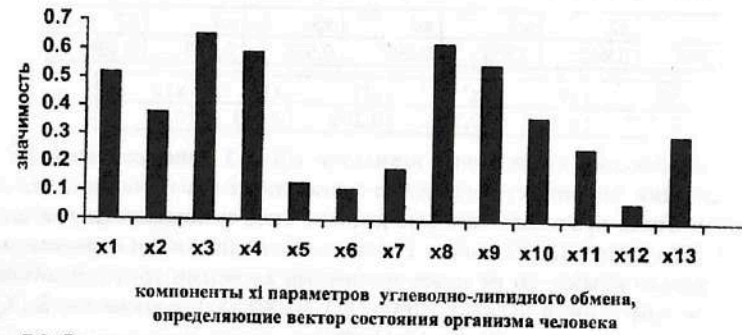
Рис. 7.8. Результаты ранжирования 13-ти клинико-лабораторных признаков углеводно-липидного кластера, (компонент x_i вектора состояния организма человека - ВСОЧ) при использовании нейро-ЭВМ (настройки нейросети) с целью сравнения параметров порядка больных СД-2 типа в стадии субкомпенсации (II группа) и больных СД-2 типа в стадии декомпенсации (III группа).

Для идентификации различий между группами больных СД-2 типа в стадии субкомпенсации (II группа) и декомпенсации (III группа) должны быть использованы параметры порядка, имеющие наибольшую диагностическую значимость (рис. 7.8 и табл. 7.11): общий ХС ( X_3 ); ЛПВП ( X_8 ); \beta -ЛП ( X_4 ); С - пептид ( X_1 ); ЛПНП ( X_9 ).