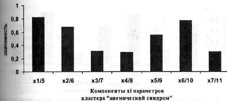
Рис. 7.15. Результаты ранжирования 7-ми компонент x_i кластера «анемический синдром», определяющих вектор состояния организма человека – ВСОЧ при использовании нейро-ЭВМ с целью сравнения параметров порядка больных СД-2 типа в стадии субкомпенсации (II гр.) и больных СД-2 типа в стадии декомпенсации (III гр.).

Идентификация различий между группами больных СД-2 типа в стадии субкомпенсации и декомпенсации (рис. 7.15, табл. 7.24) основывается на следующих критериях: количестве эритроцитов ( X_{1/5} = 0,825 ), концентрации гемоглобина ( X_{6/10} = 0,775 ), среднем корпускулярном объёме эритроцита ( X_{2/6} = 0,679 ), показателе распределения эритроцитов по объёму ( X_{5/9} = 0,561 ).