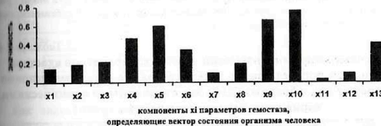
Рис. 7.23. Результаты ранжирования 13-ти компонент x_i кластера «гемостаз», определяющих вектор состояния организма человека - ВСОЧ при использовании нейро-ЭВМ (настройки нейросети) с целью сравнения параметров порядка больных СД-2 типа в стадии субкомпенсации (II группа) и больных СД-2 типа в стадии декомпенсации (III группа).

Идентификации различий больных СД-2 типа в стадии субкомпенсации и декомпенсации основывается на анализе следующих параметров порядка (рис. 7.23 и табл. 7.41): увеличения концентрации фибриногена А ( X_{10}=0,759 ), снижения АТIII ( X_9=0,658 ), укорочения АЧТВ ( X_5=0,598 ) и времени рекальцификации ( X_{10}=0,465 ) и накопление продуктов деградации фибриногена ( X_{13}=0,413 ).