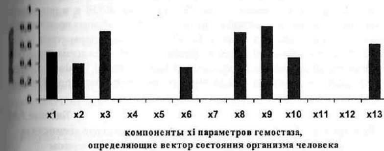
Рис. 7.25. Решение задачи минимизации: результаты ранжирования 13-ми компонент x_i кластера «гемостаз», (компонент x_i вектора состояния организма человека - ВСОЧ) при использовании нейро-ЭВМ (настройки нейросети) с целью выделения параметров порядка достаточных для идентификации 4-х репрезентативных выборок: условно здоровых лиц (группа контроля), больных СД-2 типа в стадии компенсации (I группа), субкомпенсации (II группа) и декомпенсации (III группа).

Решение задачи минимизации (сравнение всех четырех групп) при удалении из нейросети признаков, уровень значимости которых ниже 0,3, определил оптимально параметры порядка для идентификации различных больных СД-2 типа и условно здоровых лиц. Обучение и тестирование прошли успешно. Диаграмма перераспределения значимости между признаками приведена в рис. 7.25, табл. 7.43.