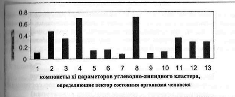
Рис. 7.2. Результаты ранжирования 13-ти клинико-лабораторных признаков углеводно-липидного кластера, (компонент х i вектора состояния организма человека - ВСОЧ) при использовании нейро-ЭВМ (настройки нейросети) с целью сравнения параметров порядка 4-х групп: условно здоровых лиц (группа контроля) и больных СД-2 типа с различными клиническими вариантами течения (I группа, субкомпенсации (II группа) и декомпенсации (III группа)).

Сравнение всех 7-х представленных графиков выявило существенное различие весовых коэффициентов (значимости) исследуемых параметров порядка кластера, характеризующего углеводно-липидный обмен (компонентов х вектора состояния больных СД) для всех 3-х клинических вариантов течения СД-2 типа в сравнении с условно здоровыми лицами.