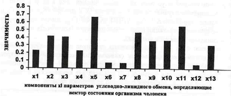
Рис. 7.3. Результаты ранжирования 13-ти клинико-лабораторных признаков углеводно-липидного кластера (компонент x_i вектора состояния организма человека - ВСОЧ) при использовании нейро-ЭВМ (настройки нейросети) с целью сравнения параметров порядка условно здоровых лиц и больных СД-2 типа в стадии компенсации (I группа).