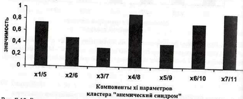
Рис. 7.12. Результаты ранжирования 7-ми компонент x_i кластера «анемический синдром», определяющих вектор состояния организма человека – ВСОЧ при использовании нейро-ЭВМ (настройки нейросети) с целью сравнения параметров порядка условно здоровых лиц и больных СД-2 типа в стадии декомпенсации (III группа).