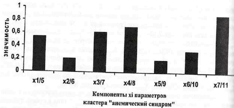
Рис. 7.11. Результаты ранжирования 7-ми компонент x_i кластера «анемический синдром», определяющих вектор состояния организма человека – ВСОЧ при использовании нейро-ЭВМ (настройки нейросети) с целью сравнения параметров порядка условно здоровых лиц и больных СД-2 типа в стадии субкомпенсации (II группа).