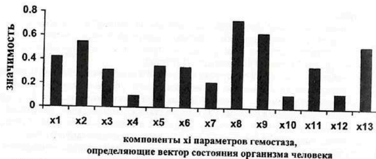
Рис. 7.18. Результаты ранжирования 13-ми компонент x_i кластера «гемостаз», определяющих вектор состояния организма человека – ВСОЧ при использовании нейро-ЭВМ (настройки нейросети) с целью сравнения параметров порядка условно здоровых лиц и больных СД-2 типа в стадии компенсации (I группа).