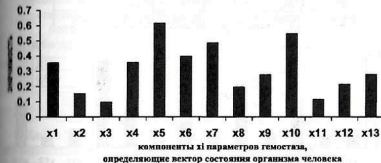
Рис. 7.20. Результаты ранжирования 13-ти компонент x_i кластера «гемостаз», определяющих вектор состояния организма человека – ВСОЧ при использовании нейро-ЭВМ (настройки нейросети) с целью сравнения параметров порядка условно здоровых лиц и больных СД-2 типа в стадии декомпенсации (III группа).

Ранжирование диагностических признаков при идентификации различий между больными СД-2 типа в стадии декомпенсации и условно здоровых лиц (рис. 7.20, табл. 7.38) показало существенную диагностическую значимость следующих диагностических признаков: укорочение АЧТВ ( X_5 = 0,616 ) и тромбинового времени ( X_7 = 0,486 ), увеличение концентрации фибриногена А ( X_{10} = 0,547 ).