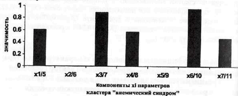
Рис. 7.17. Решение задачи минимизации: результаты ранжирования 7-ми компонент x_i кластера «анемический синдром», (компонент x_i вектора состояния организма человека – ВСОЧ) при использовании нейро-ЭВМ (настройки нейросети) с целью выделения параметров порядка достаточных для идентификации 4-х репрезентативных выборок: условно здоровых лиц (группа контроля), больных СД-2 типа в стадии компенсации (I группа), субкомпенсации (II группа) и декомпенсации (III группа).

Результаты ранжирования диагностических признаков, полученных в процессе решения задачи минимизации с использованием нейросетевых технологий (рис.7.17, табл. 7.26) позволили обосновать минимальный стандарт параметров, необходимый для идентификации различий между группами больных СД-2 типа с различными клиническими вариантами течения и условно здоровыми лицами.