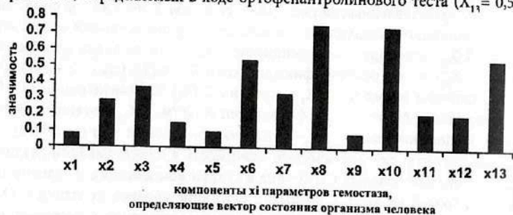
Рис. 7.19. Результаты ранжирования 13-ти компонент x_i кластера «гемостаз», определяющих вектор состояния организма человека – ВСОЧ при использовании нейро-ЭВМ (настройки нейросети) с целью сравнения параметров порядка условно здоровых лиц и больных СД-2 типа в стадии субкомпенсации (II группа).

Нейрокомпьютерный анализ выявил существенную значимость при идентификации различий между выборками больных СД-2 типа в стадии субкомпенсации и условно здоровых лиц (рис. 7.19, табл. 7.37) следующих параметров: снижение уровней протеина С ( X_8 = 0,752 ), повышение концентрации фибриногена А ( X_{10} = 0,742 ), увеличение концентрации продуктов деградации фибриногена, определяемых в ходе ортофантролинового теста ( X_{13} = 0,547 ).