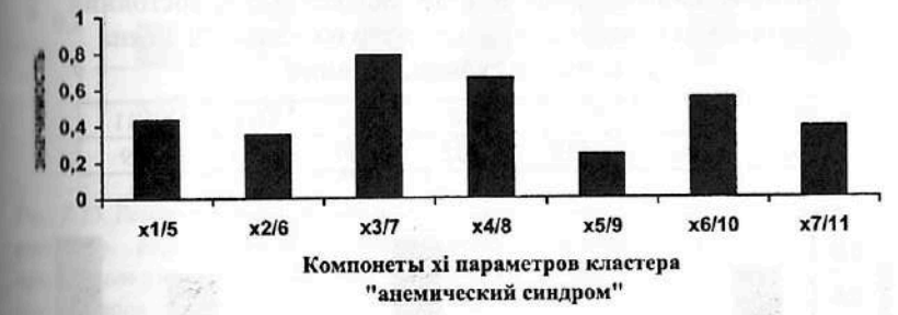
Рис. 7.10. Результаты ранжирования 7-ми компонент x_i кластера «анемический синдром», определяющих вектор состояния организма человека - ВСОЧ при использовании нейро-ЭВМ (настройки нейросети) с целью сравнения параметров порядка x_i условно здоровых лиц и больных СД-2 типа в стадии компенсации (I группа).

Идентификация различий между группами выборками больных СД-2 типа в стадии декомпенсации и условно здоровых лиц (рис. 7.12, табл. 7.21) может быть основана на анализе следующих критериев: гематокрите ( X_{7/11} = 0,909 ), средней концентрации гемоглобина в эритроците ( X_{4/8} = 0,892 ), количестве эритроцитов ( X_{1/5} = 0,735 ), концентрации гемоглобина ( X_{6/10} = 0,731 ).