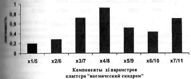
Рис. 7.13. Результаты ранжирования 7-ми компонент x_i кластера «анемический синдром», определяющих вектор состояния организма человека – ВСОЧ при использовании нейро-ЭВМ (настройки нейросети) с целью сравнения параметров порядка больных СД-2 типа в стадии компенсации (I группа) и больных СД-2 типа в стадии субкомпенсации (II группа).

Идентификация различий между группами больных СД-2 типа в стадии компенсации и субкомпенсации основана на анализе признаков, имеющих существенную диагностическую значимость (рис. 7.13, табл. 7.22): средняя концентрация гемоглобина в эритроците ( X_{4/8} = 0,921 ), гематокрит ( X_{3/7} = 0,705 ), среднее содержание гемоглобина в эритроците ( X_{3/7} = 0,717 ).