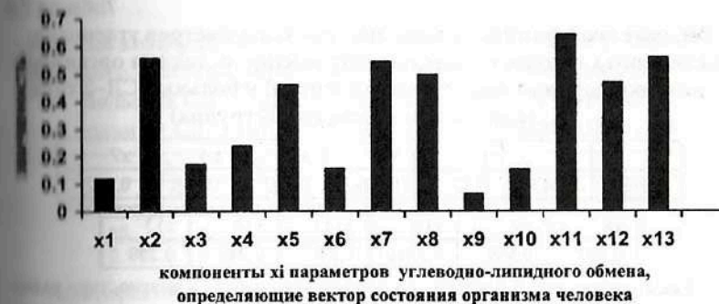
Рис. 7.4. Результаты ранжирования 13-ти клинико-лабораторных признаков углеводно-липидного кластера, (компонент x_i вектора состояния организма человека - ВСОЧ) при использовании нейро-ЭВМ (настройки нейросети) с целью сравнения параметров порядка условно здоровых лиц (группа контроля) и больных СД-2 типа в стадии субкомпенсации (II группа).

Ранжирование диагностических признаков, используемых для идентификации различий условно здоровых лиц (группа контроля) и больных СД-2 типа в стадии субкомпенсации (II группа) показало существенную диагностическую значимость следующих параметров диагностических признаков ТГЛ ( X_{11} ), K_{xc} - холестеринный коэффициент атерогенности ( X_{13} ), HbA1c ( X_7 ), коэффициент апо-В/апо-А-1 ( X_7 ), ЛПВП ( X_8 ), коэффициент апо-В/апо-А-1 ( X_7 ).