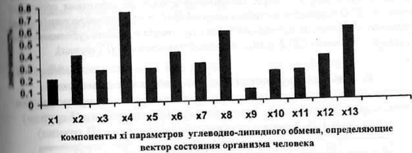
Рис. 7.7. Результаты ранжирования 13-ти клинико-лабораторных признаков углеводно-липидного кластера, (компонент x_i вектора состояния организма человека - ВСОЧ) при использовании нейро-ЭВМ (настройки нейросети) с целью сравнения параметров порядка больных СД-2 типа в стадии компенсации (I группа) и больных СД-2 типа в стадии декомпенсации (III группа).

Идентификация клинических вариантов СД-2 типа: компенсации и субкомпенсации, выявила существенную диагностическую значимость тех же диагностических признаков, которые должны быть использованы при диагностике различий СД-2 типа в стадии компенсации и субкомпенсации, но с несколько иными, но не менее значимыми весовыми коэффициентами (рис. 7.7 и табл. 7.10): \beta -ЛП ( X_4 ), HbA1c ( X_2 ), ЛПВП ( X_8 ), а также апо-В ( X_6 ), инсулинорезистентности ( X_{12} ) и HbA1c ( X_2 ).