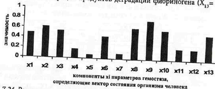
Рис. 7.24. Результаты ранжирования 13-ти компонент x_i кластера «гемостаз», (компонент x_i вектора состояния организма человека - ВСОЧ) при использовании нейро-ЭВМ (настройки нейросети) с целью сравнения параметров порядка 4-х групп: условно здоровых лиц (группа контроля) и больных СД-2 типа с различными клиническими вариантами (компенсации (I группа), субкомпенсации (II группа) и декомпенсации (III группа)).

НейроЭВМ позволила выявить существенную значимость в идентификации различий между выборками больных СД-2 типа и условно здоровых лиц (рис. 7.24, табл. 7.24) таких критериев как снижение концентрации антикоагулянтов АТIII ( X_9 = 0,7657 ) и протеина С ( X_8 = 0,615 ), увеличение концентрации фибриногена А ( X_{10} = 0,581 ), нарушения агрегации с УИА ( X_1 = 0,482 ) и ристомидином ( X_2 = 0,615 ) наряду со снижением количество тромбоцитов ( X_3 = 0,537 ) и увеличения концентрации продуктов деградации фибриногена ( X_{13} = 0,505 ).