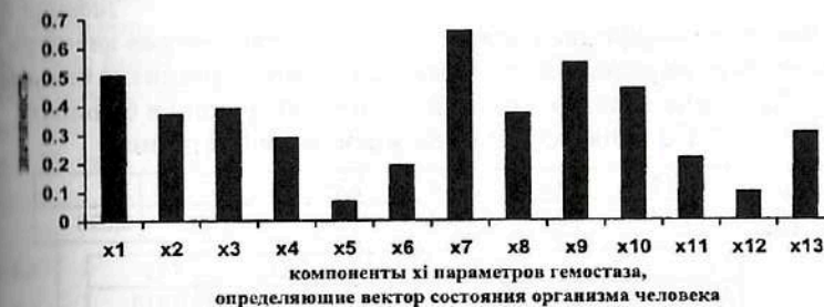
Рис. 7.22. Результаты ранжирования 13-ти компонент x_i кластера «гемостаз», определяющих вектор состояния организма человека - ВСОЧ при использовании нейро-ЭВМ (настройки нейросети) с целью сравнения параметров порядка больных СД-2 типа в стадии компенсации (I группа) и больных СД-2 типа в стадии декомпенсации (III группа).

Существенную диагностическую значимость при идентификации различий больных СД-2 типа в стадии компенсации и декомпенсации имеют следующие параметры порядка (рис.7.22 и табл. 7.40): укорочение тромбинового времени ( X_7=0,657 ), снижение антикоагулянтов АТIII ( X_9=0,547 ) и протеина С ( X_8=0,373 ), увеличение концентрации фибриногена А ( X_{10}=0,457 ), нарушения агрегации с УИА ( X_1=0,507 ) и ристомицином ( X_2=0,372 ) наряду со снижением количество тромбоцитов ( X_3=0,392 ).