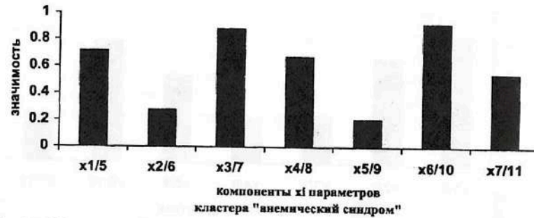
Рис. 7.16. Результаты ранжирования 7-ми компонент x_i кластера «анемический синдром», (компонент x_i вектора состояния организма человека – ВСОЧ) при использовании нейро-ЭВМ (настройки нейросети) с целью сравнения параметров порядка 4-х групп: условно здоровых лиц (группа контроля) и больных СД-2 типа с различными клиническими вариантами течения (компенсации (I группа), субкомпенсации (II группа) и декомпенсации (III группа)).

Методы системного анализа позволяют решать задачу минимизации с целью выделения минимума диагностических признаков, которые имеют существенную диагностическую значимость и обеспечивают достоверную нозологическую идентификацию клинических вариантов течения СД-2 типа с различными клиническими вариантами течения.