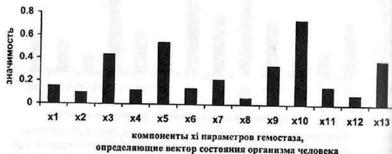
Рис. 7.21. Результаты ранжирования 13-ти компонент x_i кластера «гемостаз», определяющих вектор состояния организма человека - ВСОЧ при использовании нейро-ЭВМ (настройки нейросети) с целью сравнения параметров порядка больных СД-2 типа в стадии компенсации (I группа) и больных СД-2 типа в стадии субкомпенсации (II группа).

Существенную диагностическую значимость при идентификации различий больных СД-2 типа в стадии компенсации и декомпенсации имеют следующие параметры порядка (рис.7.22 и табл. 7.40): укорочение тромбинового времени ( X_7=0,657 ), снижение антикоагулянтов АТIII ( X_9=0,547 ) и протеина С ( X_8=0,373 ), увеличение концентрации фибриногена А ( X_{10}=0,457 ), нарушения агрегации с УИА ( X_1=0,507 ) и ристомицином ( X_2=0,372 ) наряду со снижением количество тромбоцитов ( X_3=0,392 ).