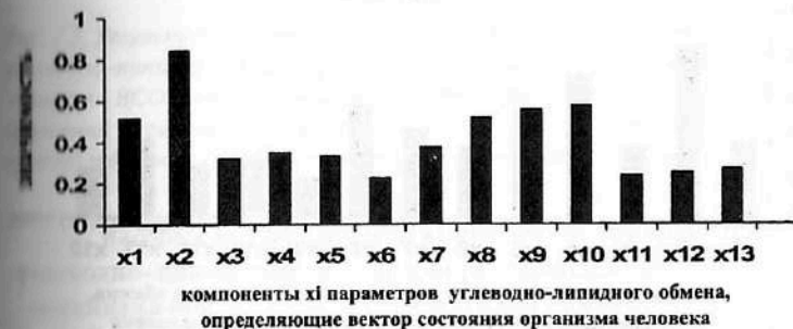
Рис. 7.5. Результаты ранжирования 13-ти клинико-лабораторных признаков углеводно-липидного кластера, (компонент x_i вектора состояния организма человека - ВСОЧ) при использовании нейро-ЭВМ (настройки нейросети) с целью сравнения параметров порядка условно здоровых лиц (группа контроля) и больных СД-2 типа в стадии декомпенсации (III группа).