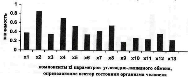
Рис. 7.6. Результаты ранжирования 13-ти клинико-лабораторных признаков углеводно-липидного кластера, (компонент x_i вектора состояния организма человека - ВСОЧ) при использовании нейро-ЭВМ (настройки нейросети) с целью сравнения параметров порядка больных СД-2 типа в стадии компенсации (I группа) и больных СД-2 типа в стадии субкомпенсации (II группа).

Ранжирование параметров порядка, входящих в кластер углеводно-липидного обмена, применительно к идентификации клинических вариантов течения СД-2 типа, а именно стадии компенсации и субкомпенсации, показало существенную диагностическую значимость следующих диагностических признаков (рис. 7.6 и табл. 7.9): HbA1c ( X_2 ), \beta -ЛП ( X_4 ), ЛПВП ( X_8 ), апо-А-1 ( X_5 ), С-пептид ( X_1 ).