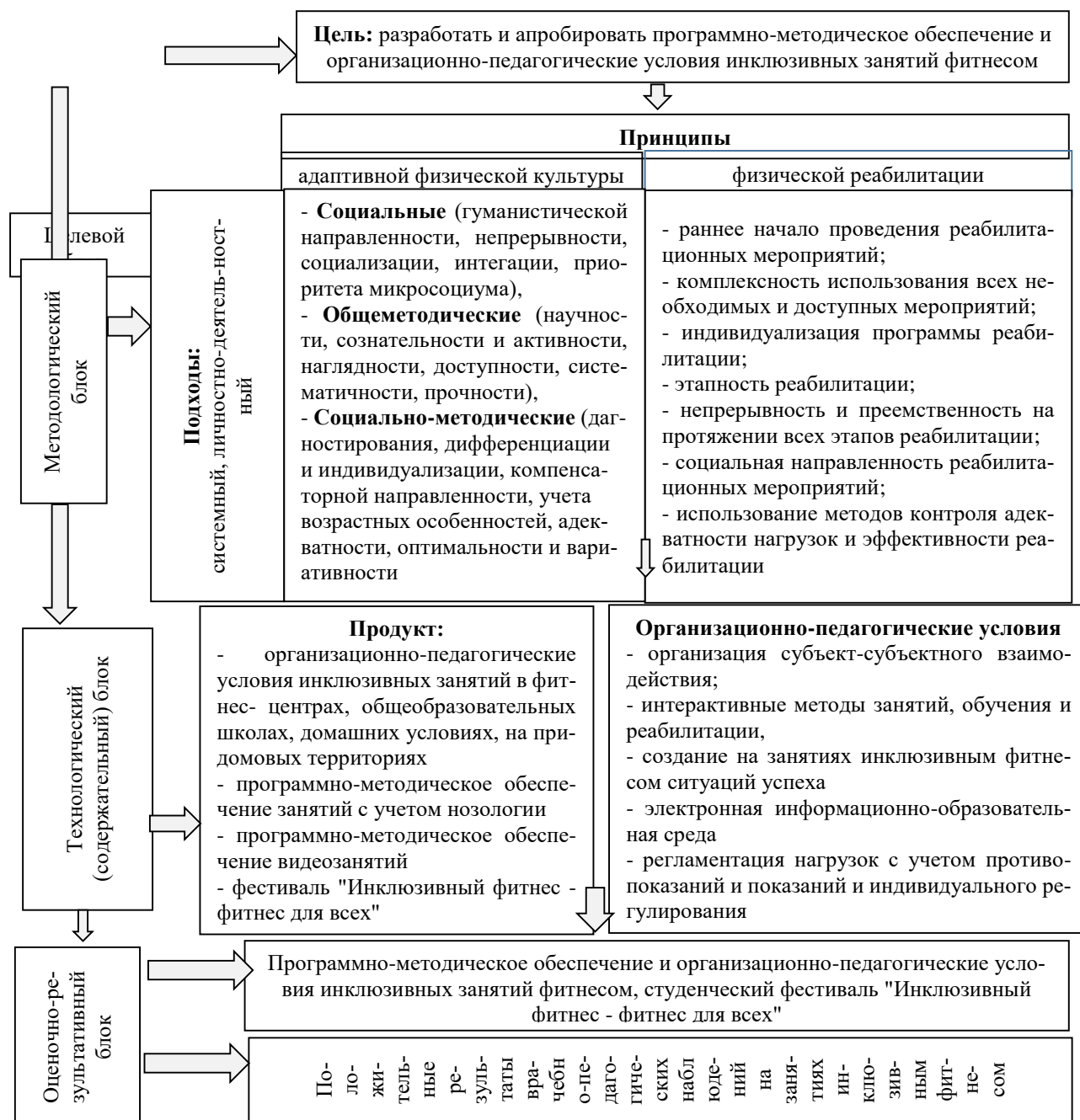
Рис. 1. Модель проекта "Инклюзивный фитнес - фитнес для всех!"